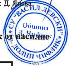
СХЕМА За оповестяване в случай на инцидент при дете/ученик жертва или в риск от насилие при кризисна интервенция